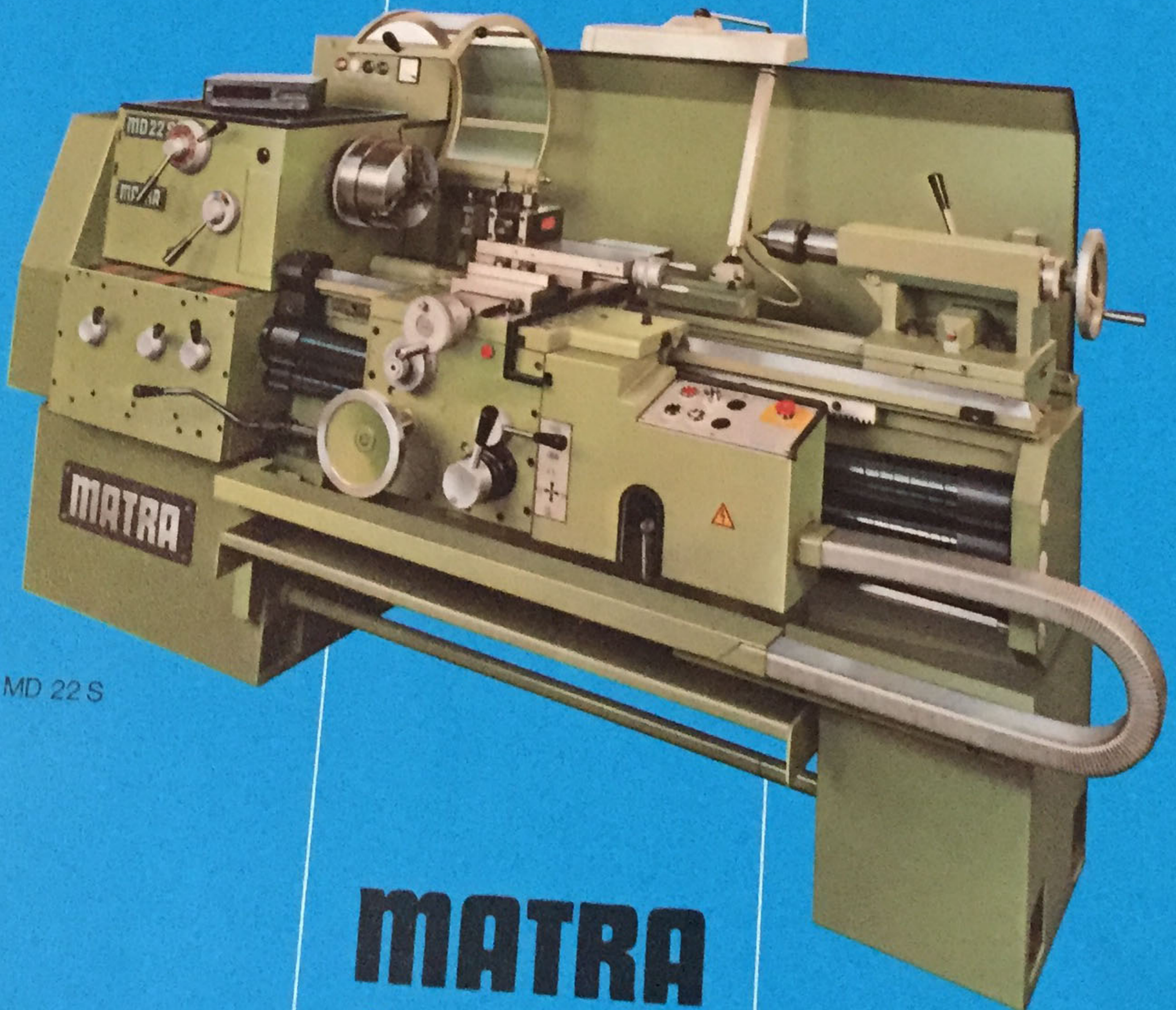
MD 22 S

MATRA Werkzeugmaschinen für die Metallbearbeitung